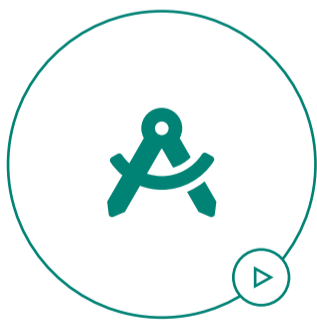
Studio d'architettura GBPA ARCHITECT

Il più grande Porsche Experience Center al mondo sarà un impianto dedicato alla passione e all'innovazione, uno spazio aperto al pubblico creato per accogliere clienti del marchio e non solo. Verranno infatti organizzati anche eventi rivolti al grande pubblico come competizioni motorsport e, nello specifico, della Carrera Cup Italia, ma anche incontri dei club, manifestazioni ed eventi di aziende partner e, in appositi spazi, programmi per la formazione del personale della rete Porsche in Italia.